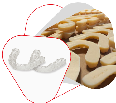
Allineatori trasparenti BIALIGNER ®